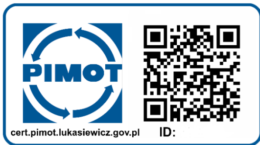
Rys. 3 - Znak zgodności z polem ochronnym