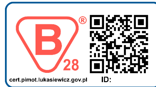
Rys. 4 - Wzór znaku B z kodem QR i polem ochronnym

Akceptuję zasady stosowania znaku zgodności, znaku B (jeśli ma zastosowanie) wskazane w niniejszym dokumencie.